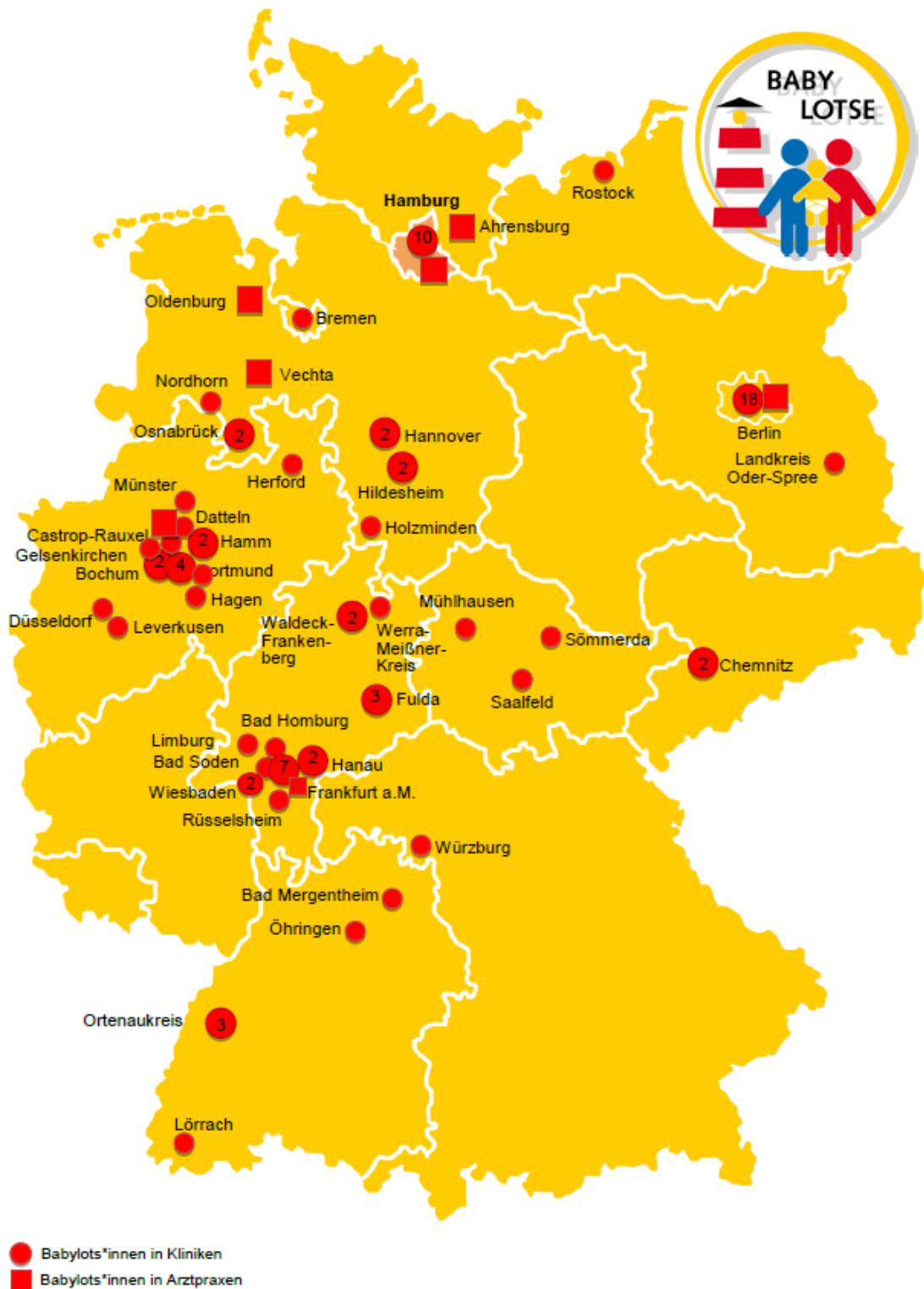
Abbildung 2 Standorte Babyotse 8

Die Karte zeigt die geografische Verteilung der Mitglieder: